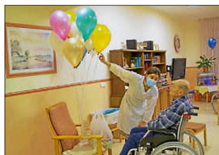
Holocaustüberlebende mit Mitarbeiterin