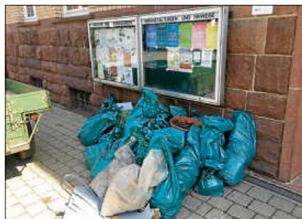
Die Ausbeute kann sich sehen lassen.

Im Wald bei Zainen fand sich eine Bett- statt mit Schlafsack und Kopfkissen. Sehr viele Flaschen waren es diesmal an der Zufahrt aus Richtung Liebenzell. Fast alle- samt Wodkaflaschen. Kein besonders be- ruhigender Gedanke, wenn man die Mög- lichkeit in Betracht zieht, dass da jemand mit Alkohol am Steuer unterwegs ist.