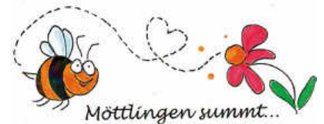
Grafik: Sylvia Bartl