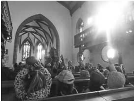
Die Kinder zeigen ihre Erntegaben.

Am Mittwoch, 30.09.2020, gestalteten die Erzieherinnen und Erzieher zusammen mit den Kindern der Kindertagesstätte Marienstift eine Erntedankfeier unter „coronabedingten“ Hygieneschutzmaßnahmen. Wir trafen uns in der Kita und gingen in zwei Gruppen getrennt voneinander und voll bepackt mit unseren Erntegaben in die evangelische Stadtkirche St. Blasius.