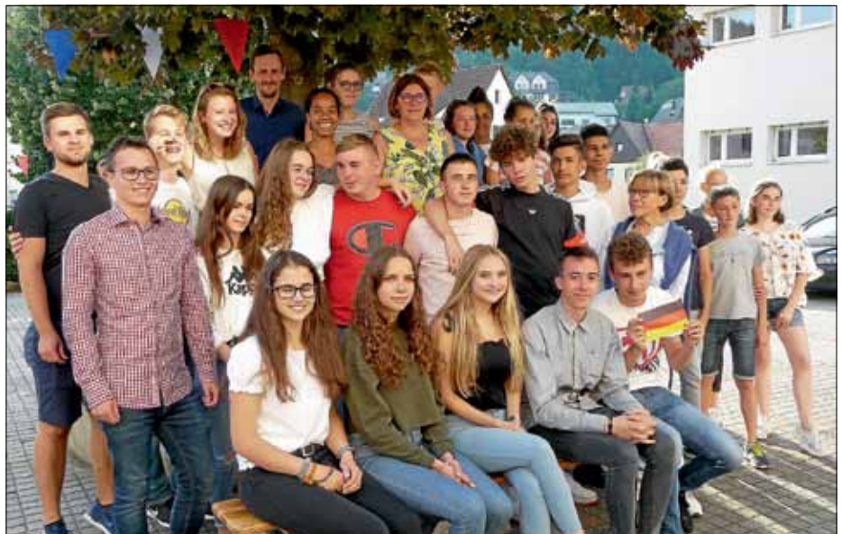
Abschiedsparty im Schulhof

Fazit: Um Nachwuchs in der Städtepartnerschaft muss man sich keine Sorgen machen.