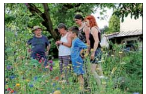
Jede Fläche mit bienenfreundlichen Blüten hilft.

Seit Anfang des Jahres ist die Aktionsgruppe „Möttlingen summt“ aktiv. Am 26.07.2019 wurden bei einer kleinen Runde einige insektenfreundliche Flächen in Möttligen inspiziert und Tipps ausgetauscht. Die Gruppe rund um Elfriede Heeskens, Barbara Strohmeyer und Carmen Klein freut sich auf weitere Mitstreiter*innen für ein summendes Möttligen. Sprechen Sie sie doch einfach an und machen Sie mit.