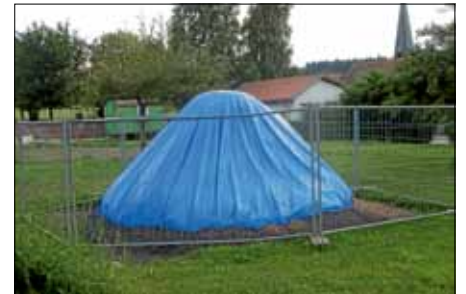
Der erkaltete Meiler

Nun sind unsere Kohlenmeiler-Festtage schon über einen Monat Geschichte. In der Zeit danach hatte der Meiler jetzt Zeit, gründlich auszukühlen. Eine Folie verhinderte die Zufuhr von Sauerstoff und damit das, was die Kohle am Liebsten getan hätte, nämlich zu verbrennen.