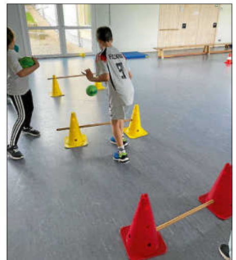
„Handball in die Grundschule“

Es folgten sechs Übungsstationen rund ums Thema Pellen, Passen, Werfen und Fangen. Am Ende wurde in Teams das Spiel „Handball-Touch-Down“ gegeneinander gespielt. Hierbei wurden Fähigkeiten wie Taktik, Koordination, Ball-Geschicklichkeit und Teamgeist geschult. In den folgenden Wochen werden die Schüler/innen noch weitere Übungsformen des Handballsports im Sportunterricht kennen lernen.