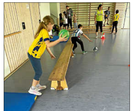
„Handball in die Grundschule“

Handball bietet eine gute Möglichkeit für Mädchen und Jungen, sich mit Gleichaltrigen auszutoben – nach Regeln, fair und emotional. Neben der Förderung von Kondition sowie Koordination, besonders der Ball-Geschicklichkeit, steht der gemeinsame Spaß im Vordergrund, der auf ein lebenslanges Sporttreiben neugierig machen soll.