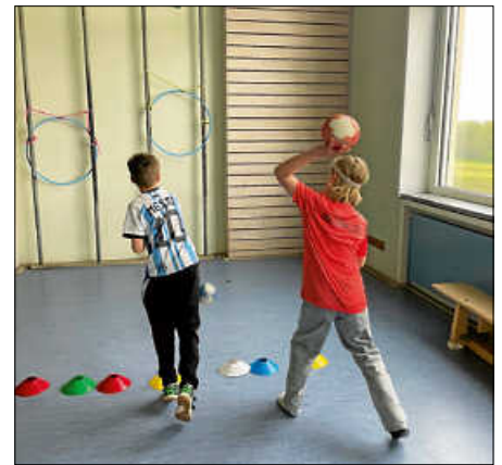
„Handball in die Grundschule“