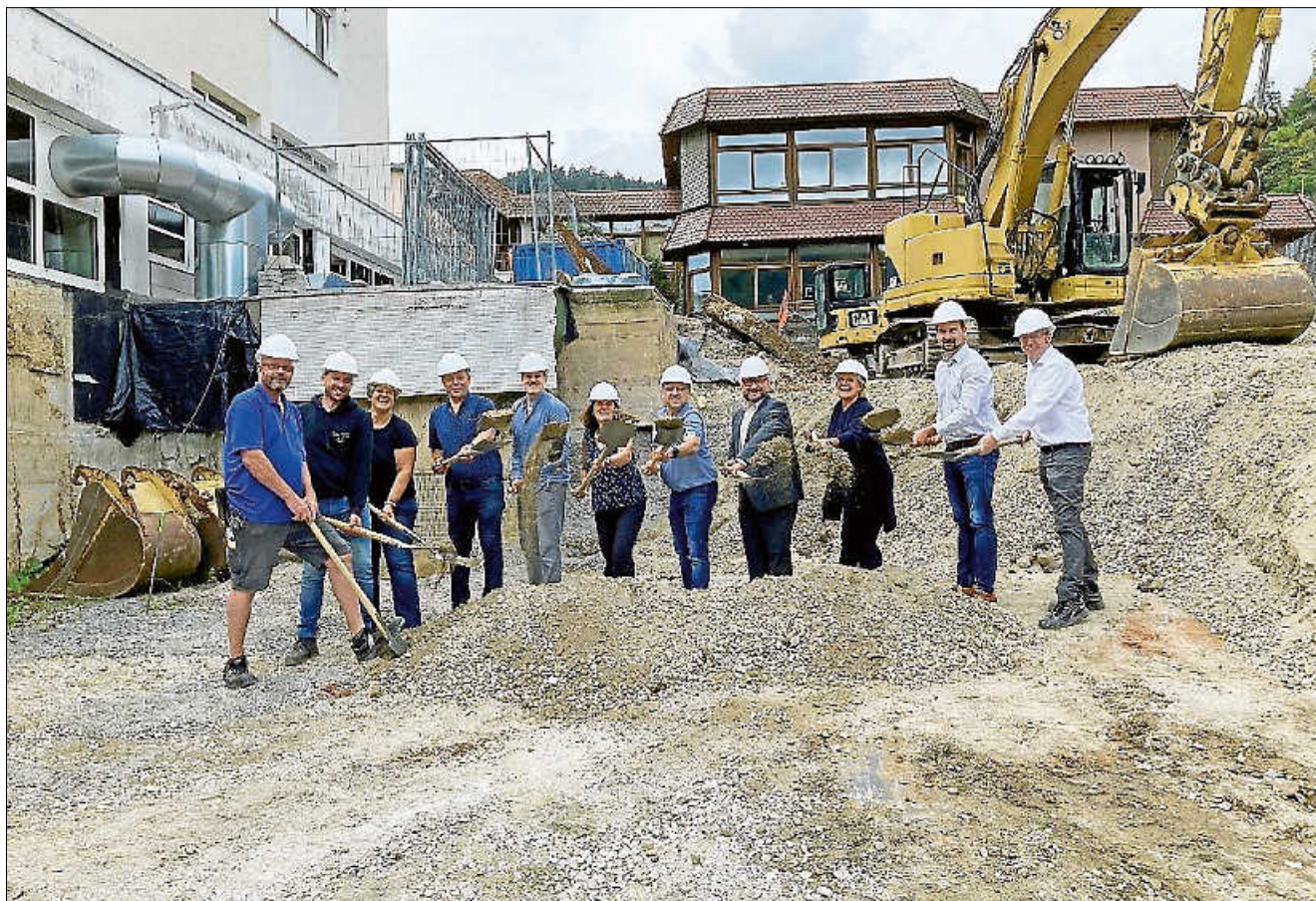
Spatenstich am 13.09.2023

Die Baustelle wird in der Rohbauphase von der Pforzheimer Straße (B463) mit Ampelregelung bedient.