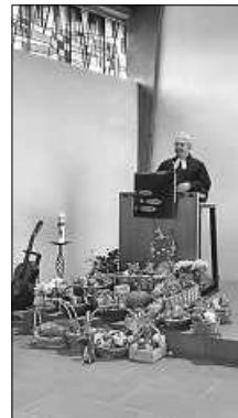
Der Erntedankaltar

Am 9. Oktober 2022 haben wir am Erntedankgottesdienst in der Christuskirche in Unterhaugstett teilgenommen. Mit Ährenkränzchen und bunt geschmückten Erntedankkörbchen sind wir in die Kirche eingezogen. Wir haben mit zwei Liedbeiträgen für die Ernte gedankt. Es war ein schönes Erlebnis für alle Gottesdienstteilnehmer. Die Erntedankgaben gingen an den CARIsatt Tafelladen in Calw.