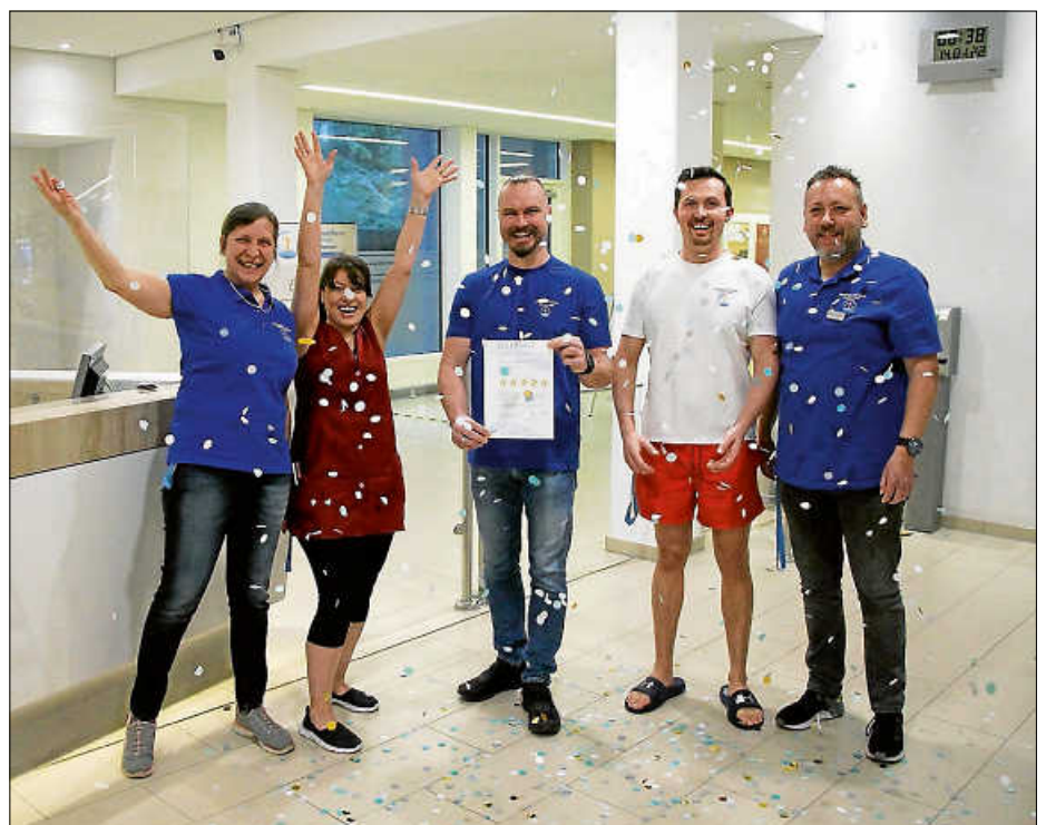
Die Mitarbeiter der Paracelsus-Therme freuen sich über den fünften Wellness-Star.

Alle Infos sind unter www.paracelsus-therme.de zu finden.